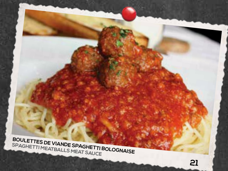
BOULETTES DE VIANDE SPAGHETTI BOLOGNAISE SPAGHETTI MEATBALLS MEAT SAUCE

CRÈME 35%, BEURRE, JAUNE D'OEUF, ÉCHALOTES, LE TOUT COUVERT DE SMOKED MEAT / 35% CREAM, BUTTER, EGG YOLK, TOPPED WITH SMOKED MEAT AND SHALLOTS