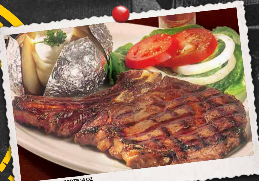
STEAK D'ENTRECÔTE 14 OZ 14 OZ AAA RIB STEAK