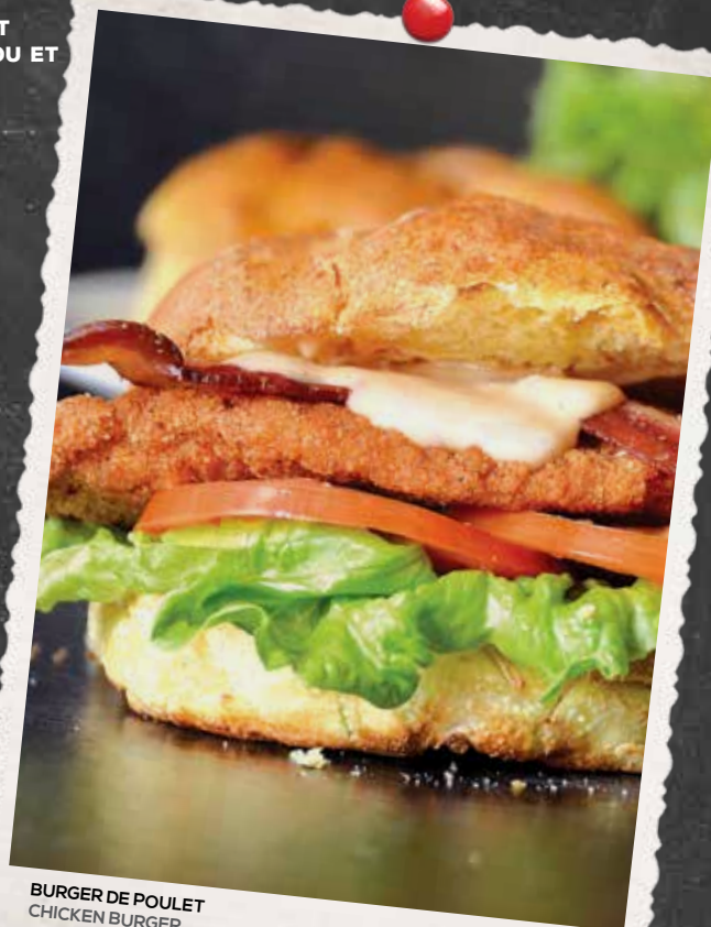
BURGER DE POULET CHICKEN BURGER

NOTRE HOT DOG GÉANT TOUT BŒUF GRILLÉ RECOUVERT DE NOTRE CÉLÈBRE SAUCE À LA VIANDE ET SERVI AVEC FRITES FRAÎCHEMENT COUPÉES OUR JUMBO GRILLED ALL BEEF HOT DOG TOPPED WITH OUR FAMOUS MEAT SAUCE, SERVED WITH FRESH CUT FRIES