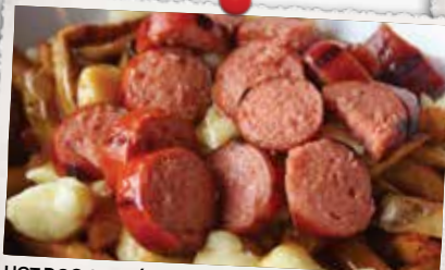
HOT DOG GRILLÉ TOUT BOEUF GRILLED ALL BEEF HOT DOG