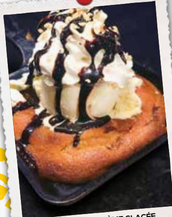
BISCUIT CHAUD ET CRÈME GLACÉE HOT COOKIE AND ICE CREAM 9 90