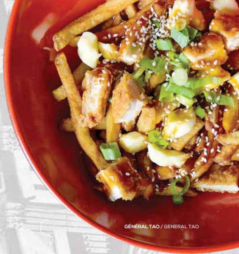
GÉNÉRAL TAO / GENERAL TAO