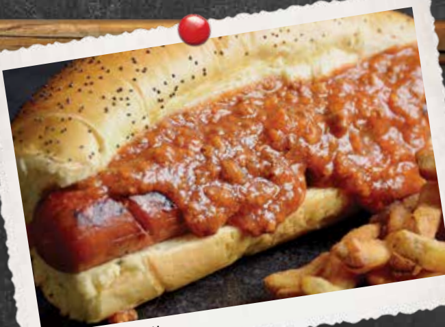
HOT DOG MICHIGAN

POITRINE DE POULET PANÉE, BACON, LAITUE, TOMATE ET NOTRE MAYONNAISE MAISON ÉPICÉE BREADED CHICKEN BREAST, BACON, LETTUCE, TOMATO AND OUR HOUSE SPICY MAYO