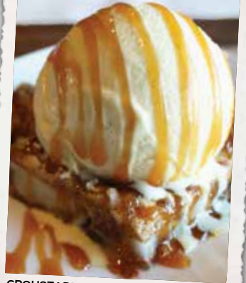
CROUSTADE AUX POMMES APPLE CRISP 9 90