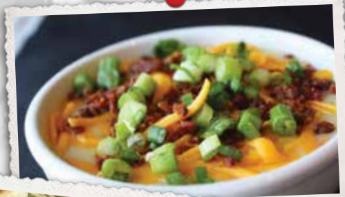
SOUPE LOUISIANE LOUISIANA SOUP