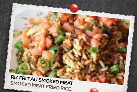
RIZ FRIT AU SMOKED MEAT SMOKED MEAT FRIED RICE

AJOUTEZ DU FROMAGE DANS VOTRE SANDWICH ADD CHEESE IN YOUR SANDWICH +2 75