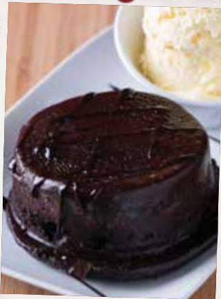
VOLCAN AU CHOCOLAT CHOCOLATE VOLCANO 9 90