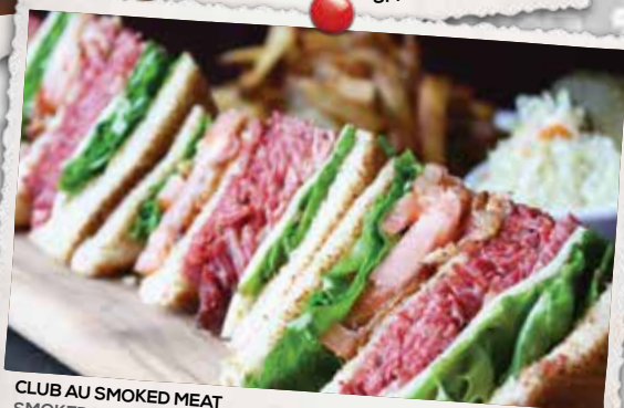
CLUB AU SMOKED MEAT SMOKED MEAT CLUB