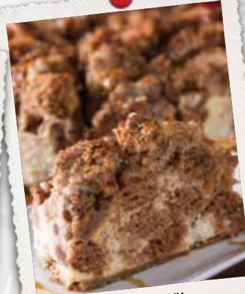
GÂTEAU AU FROMAGE AUX CAROTTES ET CARAMEL CARROT CARAMEL CHEESECAKE 9 90