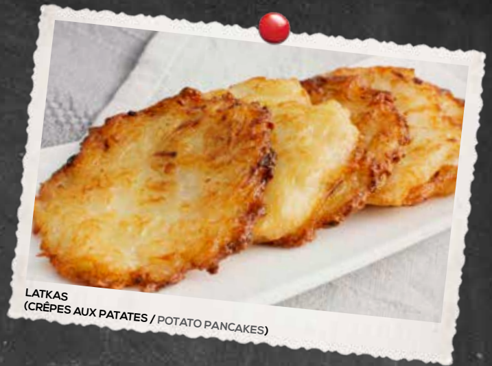
LATKAS (CRÊPES AUX PATATES / POTATO PANCAKES)

2 PELURES DE POMMES DE TERRE, 6 EGG ROLLS AU SMOKED MEAT, 6 BÂTONNETS DE FROMAGE ET RONDELLES D'OIGNON / 2 POTATO SKINS, 6 SMOKED MEAT EGG ROLLS, 6 CHEESE STICKS AND ONION RINGS