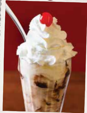
SUNDAE À L'ANCIENNE OLD FASHIONED ICE CREAM SUNDAE 9 90