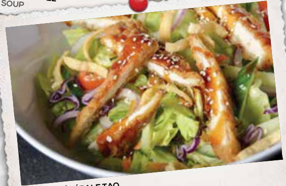
SALADE GÉNÉRALE TAO GENERAL TAO SALAD