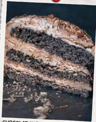
CHOCOLAT CHOCOLAT CHOCOLAT CHOCOLATE CHOCOLATE CHOCOLATE CAKE 9 90