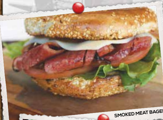
SMOKED MEAT BAGEL

NOTRE CÉLÈBRE SMOKED MEAT, FROMAGE SUISSE, BACON, LAITUE ET TOMATES. OUR FAMOUS SMOKED MEAT, SWISS CHEESE, CRISP BACON, LETTUCE AND TOMATO.