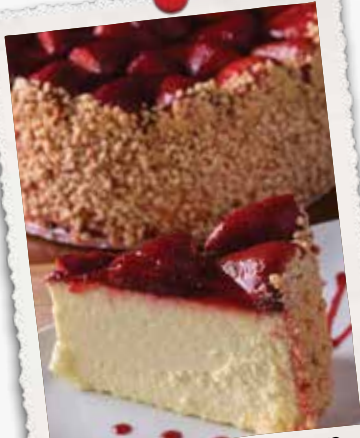
GÂTEAU AU FROMAGE AUX FRAISES STRAWBERRY CHEESECAKE 9 95