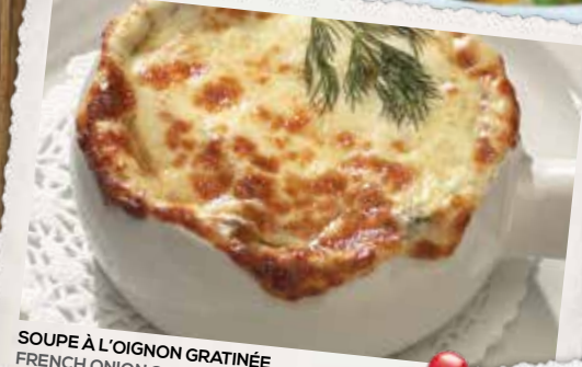
SOUPE À L'OIGNON GRATINÉE FRENCH ONION SOUP